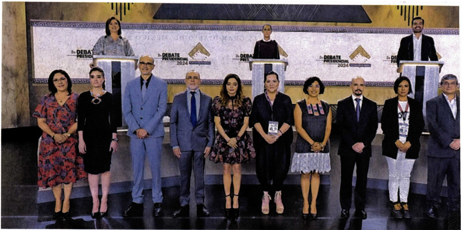
El Segundo Debate Presidencial se llevó a cabo en los Estudios Churubusco, donde hubo momentos rípidos y acusaciones entre las dos candidatas al cargo.