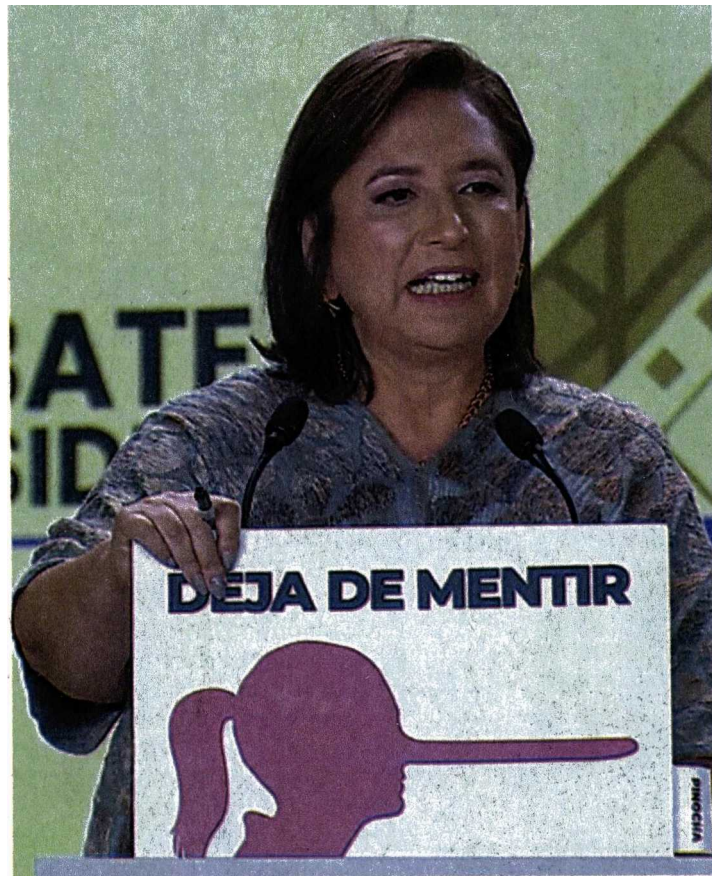
Xóchitl Gálvez enfocó sus baterías contra Claudia Sheinbaum, a la que llamó “la candidata de las mentiras” y “narcocandidata”.