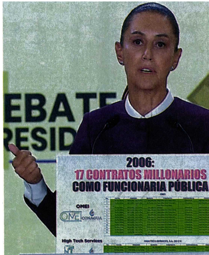
Claudia Sheinbaum acusó que las empresas de Gálvez obtuvieron millonarios contratos cuando fue funcionaria y la tildó de corrupta.