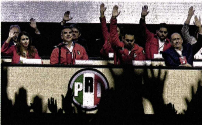
■ Adentro, el líder tricolor acusó de cínicos y esquirols a quienes, molestos con su actuar, dejaron al partido.