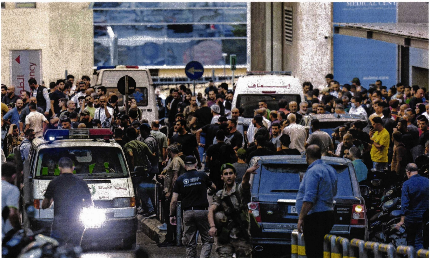
Libaneses al rodear ayer ambulancias en la entrada del Centro Médico de la Universidad Estadounidense de Beirut.

La milicia Hezbolá dice que los dispositivos de sus integrantes fueron los afectados y acusa a Israel del ataque; Estados Unidos niega implicación; Israel no hace comentarios