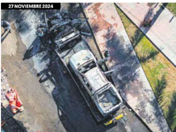
Violencia. Sujetos armados incendiaron una grúa y el auto que transportaba