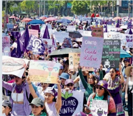
Miles de mujeres han marchado para exigir justicia por ellas en un país donde se registran más de 60 feminicidios al mes.

Fuente: Registro Nacional de Personas Desaparecidas y No Localizadas (RNFDNO).