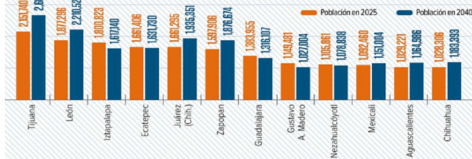
Fuente: elaboración propia con base en los datos de: https://www.gob.mx/conapodocumentos/reconstruccion-y-proyecciones-de-la-poblacion-de-los-municipios-de-mexico-1990-2040

Hay municipios en México donde, cada uno de ellos, alberga un millón o más habitantes. Se trata de unidades geográficas inmensas que implican retos de todo tipo que van desde la provisión de bienes y servicios, pasando por los temas ambientales y del cambio climático, hasta llegar a cuestiones sociales como la violencia, la economía, y en general, el desarrollo. Se trata de 12 municipios localizados en siete entidades de la República, donde habitaban, en 2025, al menos 17.5 millones de personas. Se espera que para el 2040, alberguen por lo menos alrededor de 18.85 millones. Es un cambio muy acelerado que seguramente hará mucho más compleja su gestión y gobernanza.